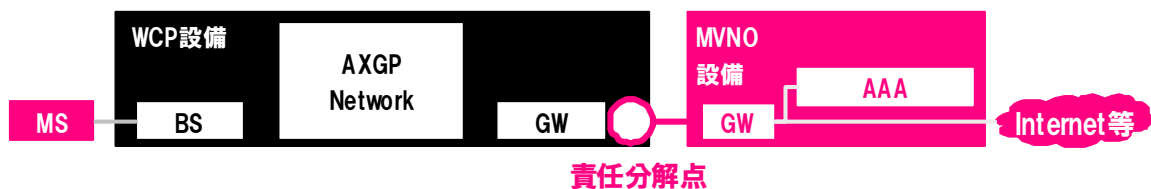
図 3-1 プラン 1 構成図

プラン 1 では、L3 接続を提供します。WCP が指定する POI(Point Of Interface)に対して MVNO が用意した回線で接続します。